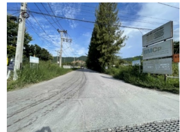
เส้นทางขนส่งแร่เข้าสู่โครงการ