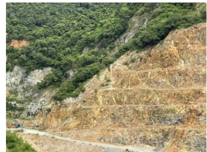
พื้นที่เว้นการทำเหมือง