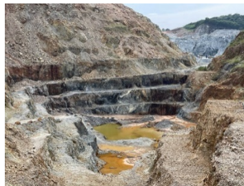
พื้นที่หน้าเหมืองปัจจุบัน

พื้นที่โครงการ ประทานบัตรที่ 21380/15246