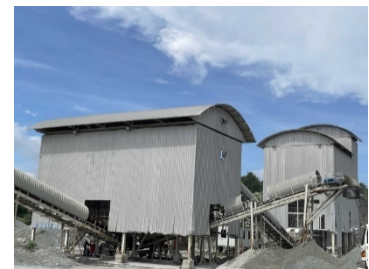
พื้นที่โรงโม่หินของโครงการ