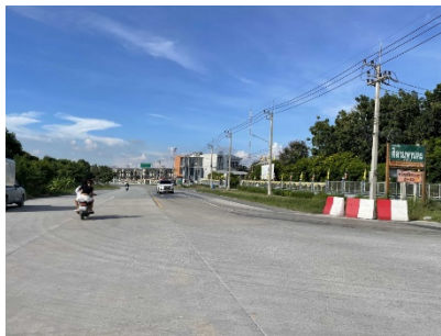
ทางหลวงหมายเลข 3144