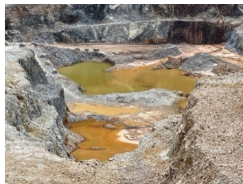
บ่อขุมเหมือง (Sump)